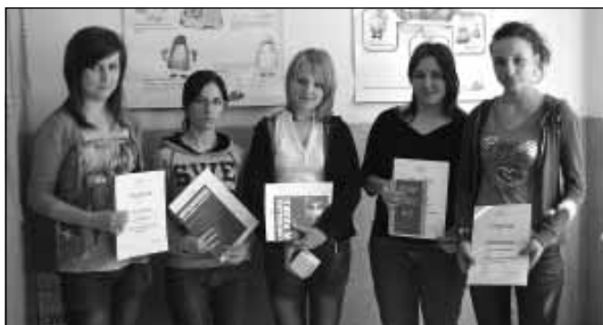
Laureatki I edycji Szkolnego Konkursu Bankowego.