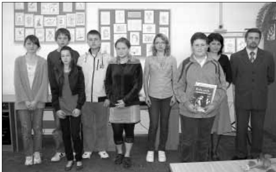
Jury wraz z laureatami konkursu.

Oficjalne ogłoszenie wyników z udziałem członków Jury miało miejsce w czytelni Biblioteki w środę 26 maja o godz. 16 15 . Laureatom wręczono wówczas dyplomy oraz atrakcyjne nagrody książkowe. Dokonał tego wiceprezes