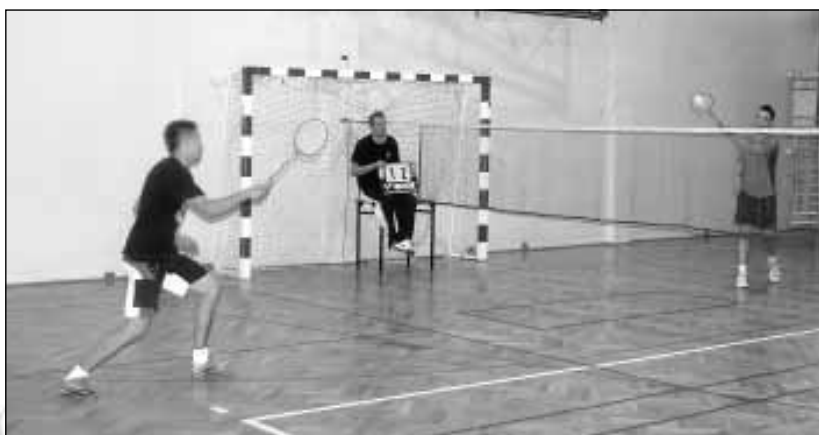
Zawodnicy podczas meczu.