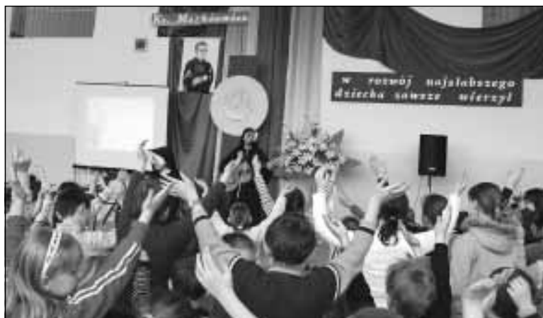
Spotkanie młodzieżowej grupy na sali gimnastycznej.