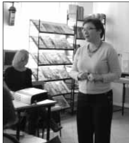
Spotkanie młodzieży z doradcą zawodowym.