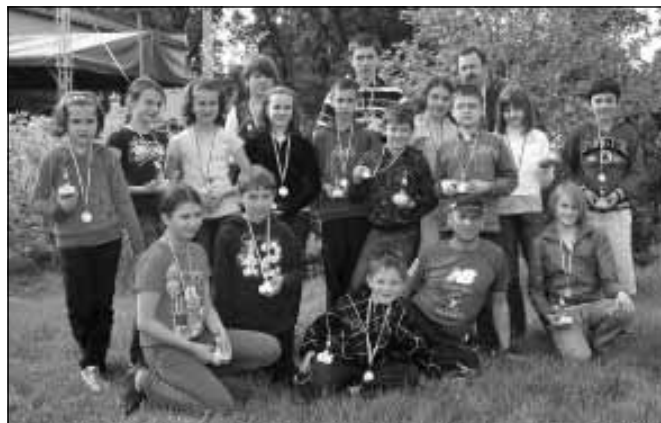
Pamiątkowe zdjęcie zawodników sekcji pływackiej.