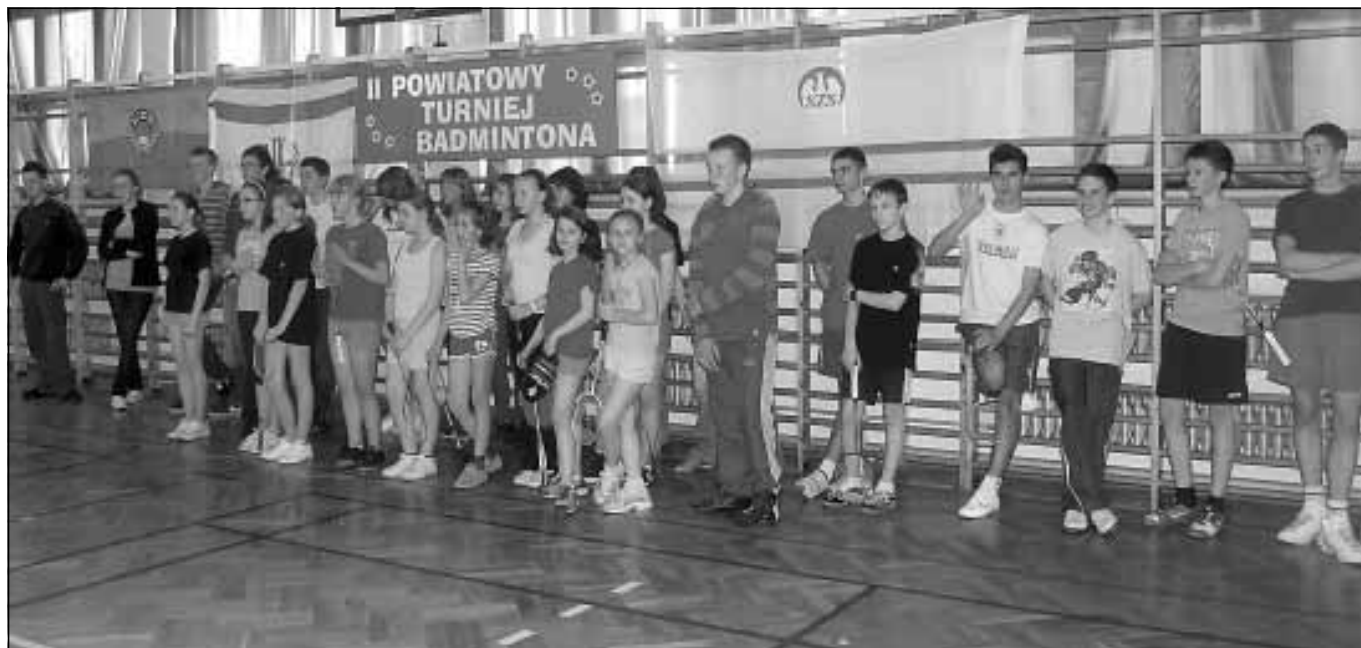
Uczestnicy II Powiatowego Turnieju Badmintona.