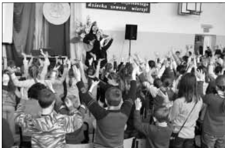
Nauka piosenki z pokazywaniem na sali gimnastycznej.