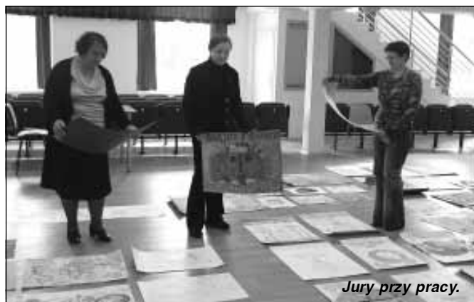
Jury przy pracy.

Na konkurs wpłynęło ogółem 105 plakatów w formatach od A-3 do A-1, wykonanych różnymi technikami, w dwóch kategoriach wiekowych: 10 – 12 lat i 13 – 16 lat z 10 placówek oświatowych z terenu powiatu rzeszowskiego: Zespołu Szkół z Górną, Gimnazjum Publicznego z Hyżnego, Zespołu Szkół z Wólki Niedźwiedzkiej, Sokołowa Młp., Trzebuski, Wysokiej Głogowskiej i Łowiska; Szkół Podstawowych z Lubeni i Straszdyła oraz Zespołu Szkół nr 2 z Nienadówki.