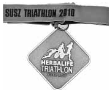
Medal zdobyty przez W. Sondej, rewers.