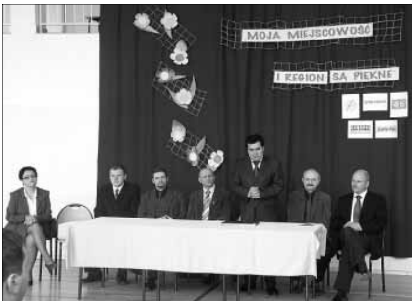
Zaproszeni goście oraz jury konkursu.