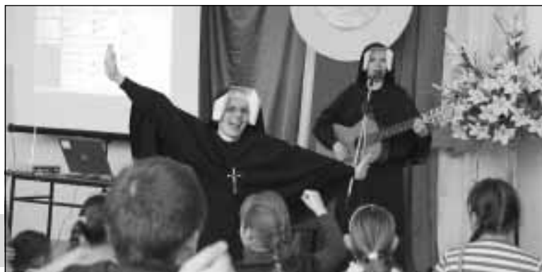
Z radością głosicie Ewangelię.