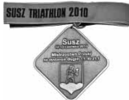
Medal zdobyty przez W. Sondej, awers.