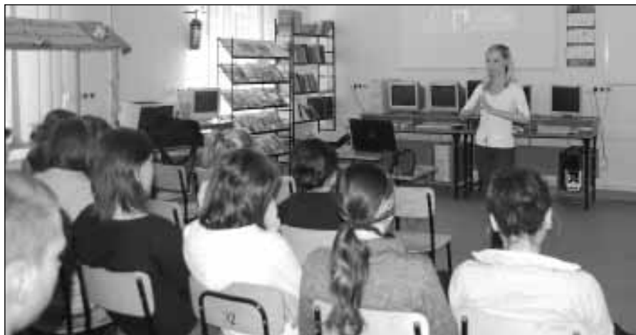
Zajęcia z cyklu „Ciekawe lekcje”.