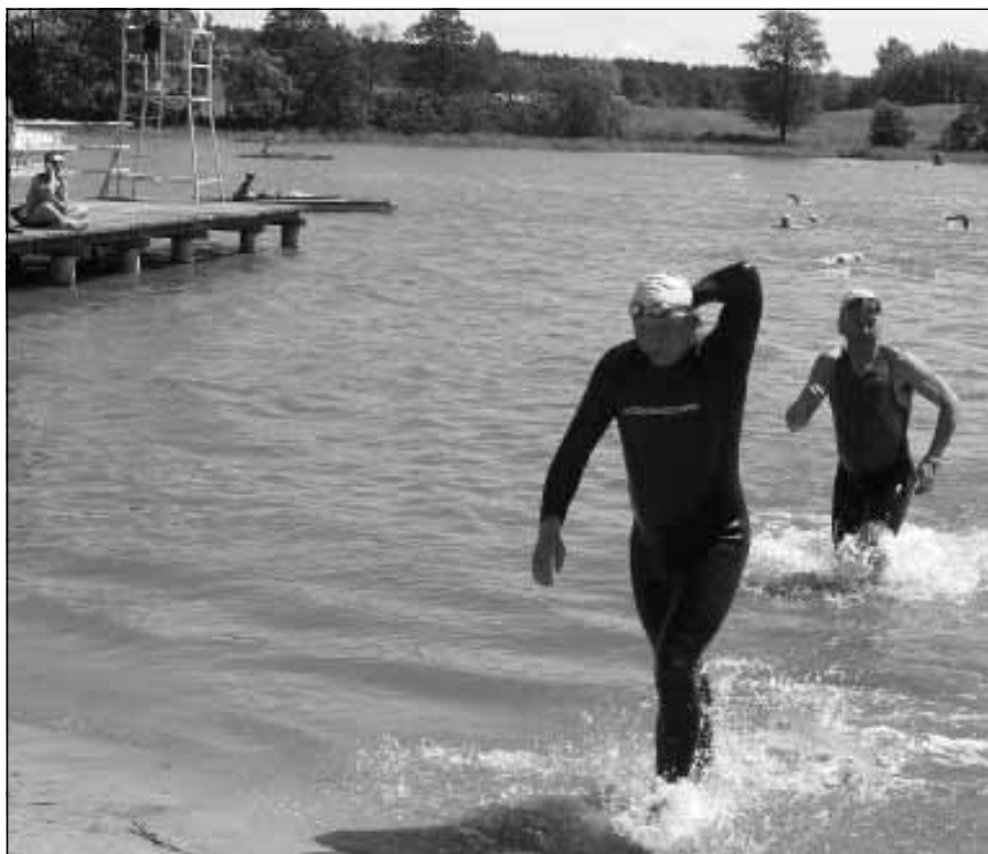
Triathlon to wspaniała dyscyplina sportowa, która łączy w sobie kombinację pływania, kolarstwa i biegania.