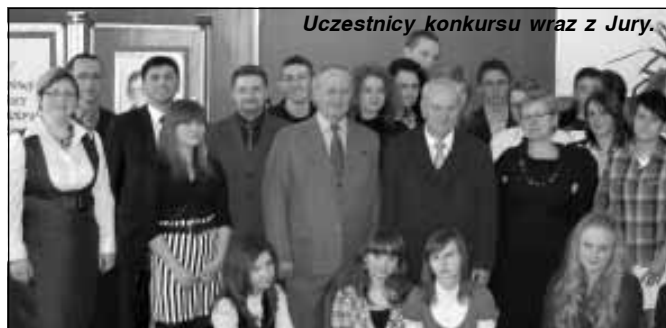
Uczestnicy konkursu wraz z Jury.