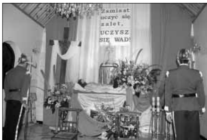
Boży Grób w kaplicy przedpogrzebowej.