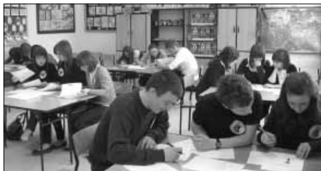
Przysłowiowa burza mózgów.