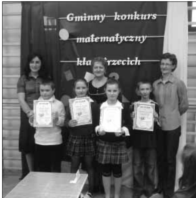
Laureaci konkursu matematycznego.