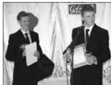
Absolwenci nagrodzeni za szczególne osiągnięcia w dziedzinie sportu.