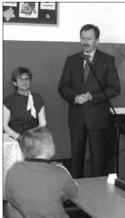
Uroczyste otwarcie konkursu.